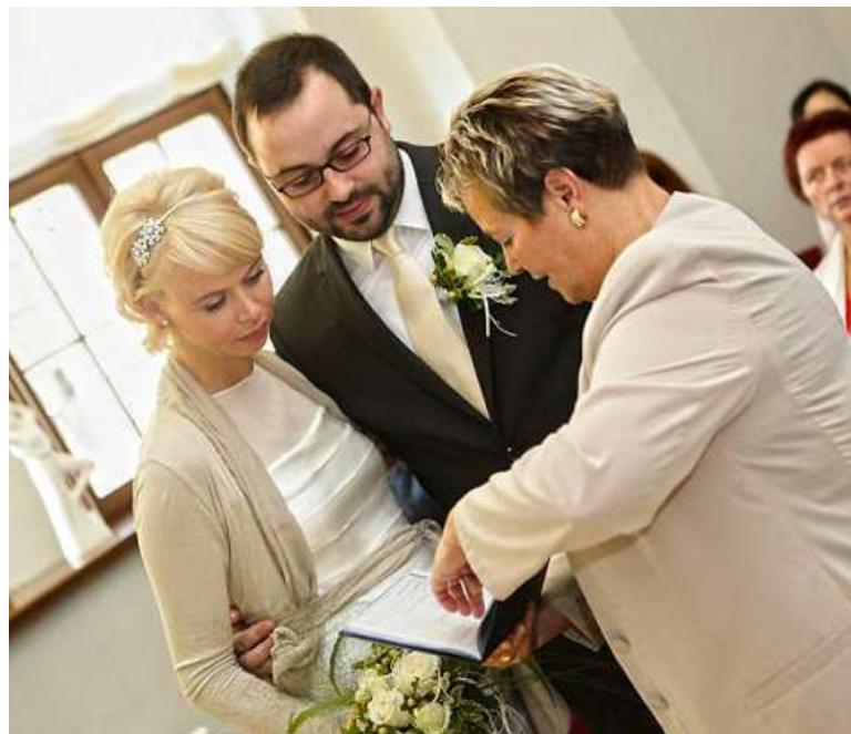
Standesamt, Hochzeit – Montalbano, Stadt Zwickau / Standesamt

Bürgerservice (Antragstellung und Ausgabe), Hauptmarkt 1, 08056, Tel. 0375 830