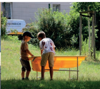
An besonders heißen Sommertagen bringen Wasserspiele Abkühlung.