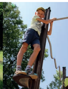
Bei uns kann man auch hoch hinaus.