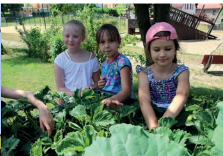
In unserem Hortgarten wird Obst und Gemüse angepflanzt, geerntet und genascht.