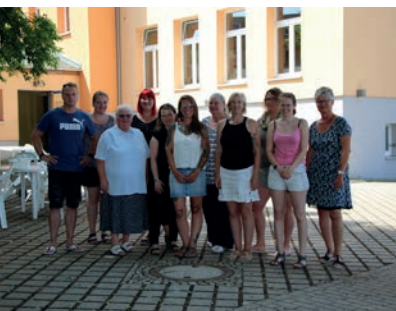
Team der Einrichtung