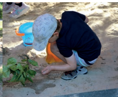
Hier kann jeder nach Belieben auf Entdeckertour gehen.