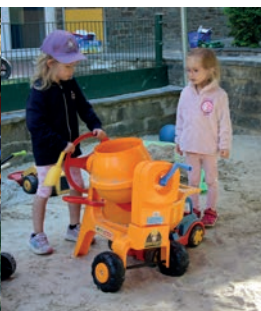
Im Sandkasten gibt's tolle Spielmöglichkeiten.