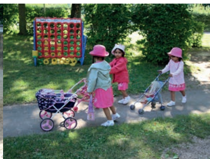
Auch kleine Puppenmuttis können hier entspannt flanieren.