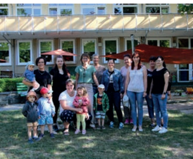
Team der Einrichtung