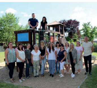
Team der Einrichtung