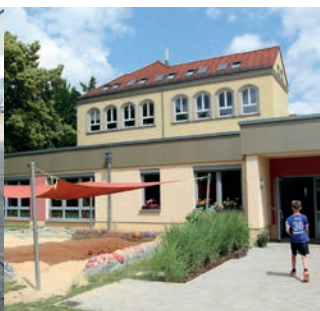
Der neue Hortbereich in der Grundschule Crossen ist KLASSE!