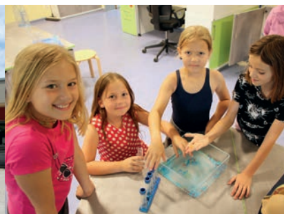
Hier können die Hortkinder auch forschen und auf spannende Entdeckertour gehen.