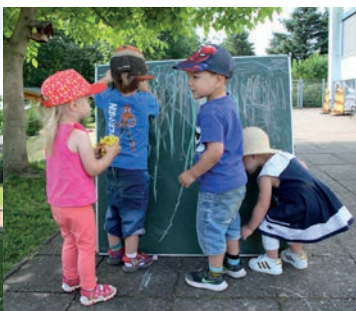
Im großen Außengelände locken viele Spielmöglichkeiten.