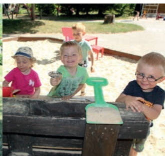
Ein großzügiger Außenbereich sorgt für viel Kurzweil.