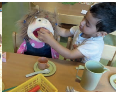
Besonders beliebt sind Rollenspiele ...