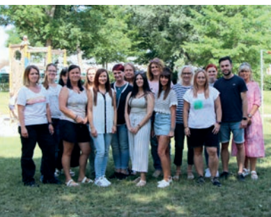
Team der Einrichtung