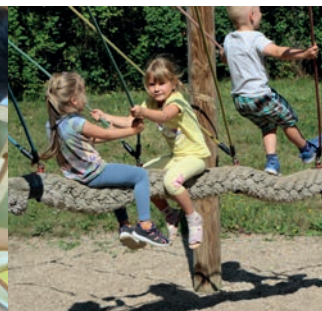
... und die große Seilschaukel im Garten.