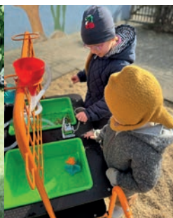
Die Kinder lieben es zu matschen.