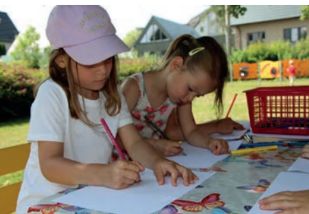
Im schönen Außenbereich finden unsere Kinder viele schattige Plätze, um ihrem Bewegungsdrang und kreativen Neigungen nachzugehen.