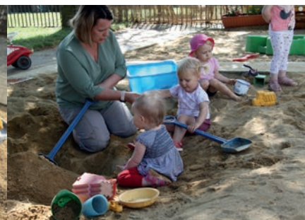
Ideal für die Jüngsten: ein Sandkasten unterm Kirschbaum.