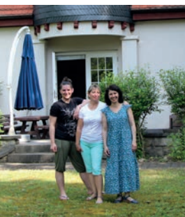
Team der Einrichtung