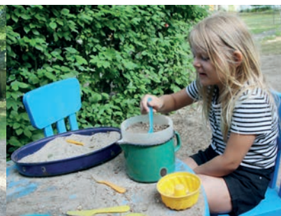
Für kleine Gourmetköche von morgen steht allerlei Utensil zur Verfügung.