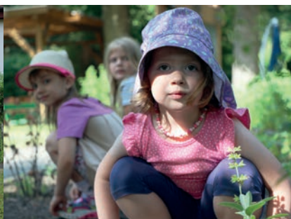
Im schattigen Garten pflanzen, ernten und naschen die Kids auch Obst und Gemüse.