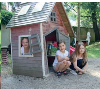
Eine wahrlich schräge Holzhütte bietet viel Raum für Rollenspiele.