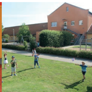
Unsere schönen Außenanlagen bieten viel Bewegungsfreiheit.