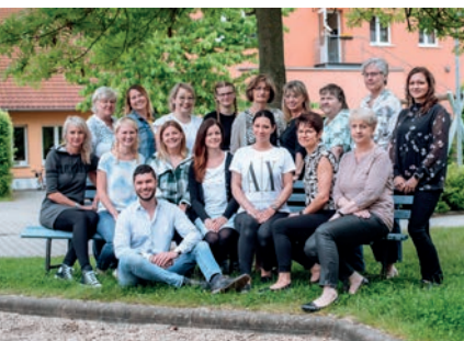
Team der Einrichtung