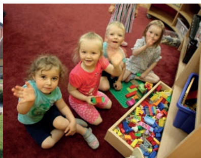
Großzügige Gruppenräume lassen kleinen Bau-Löwen viel Spielraum.