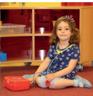
Eines der beliebtesten Rollenspiele: Pupp doktor Pille.