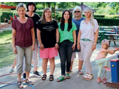
Team der Einrichtung