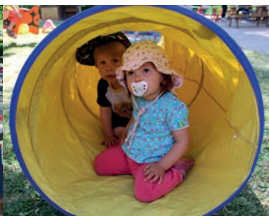
Der Kriechtunnel wird zum perfekten Beobachtungsposten.