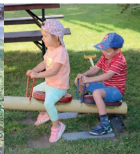
Der schön angelegte Außenbereich bietet den Mädchen und Jungen viel Raum für Bewegung, Spiel und Kurzweil.