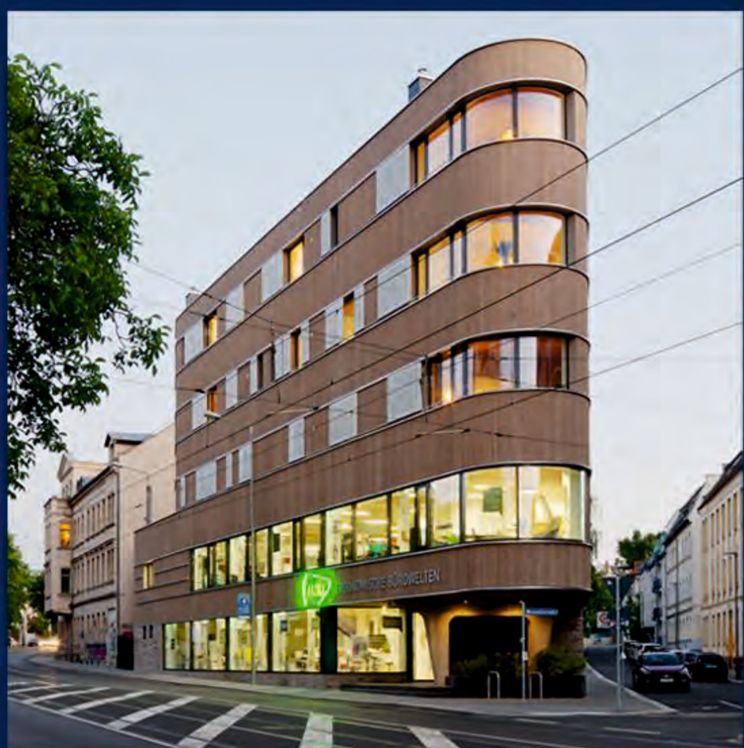
Leipzig / Felsenkellerstraße 1 / Architekten ASUNA