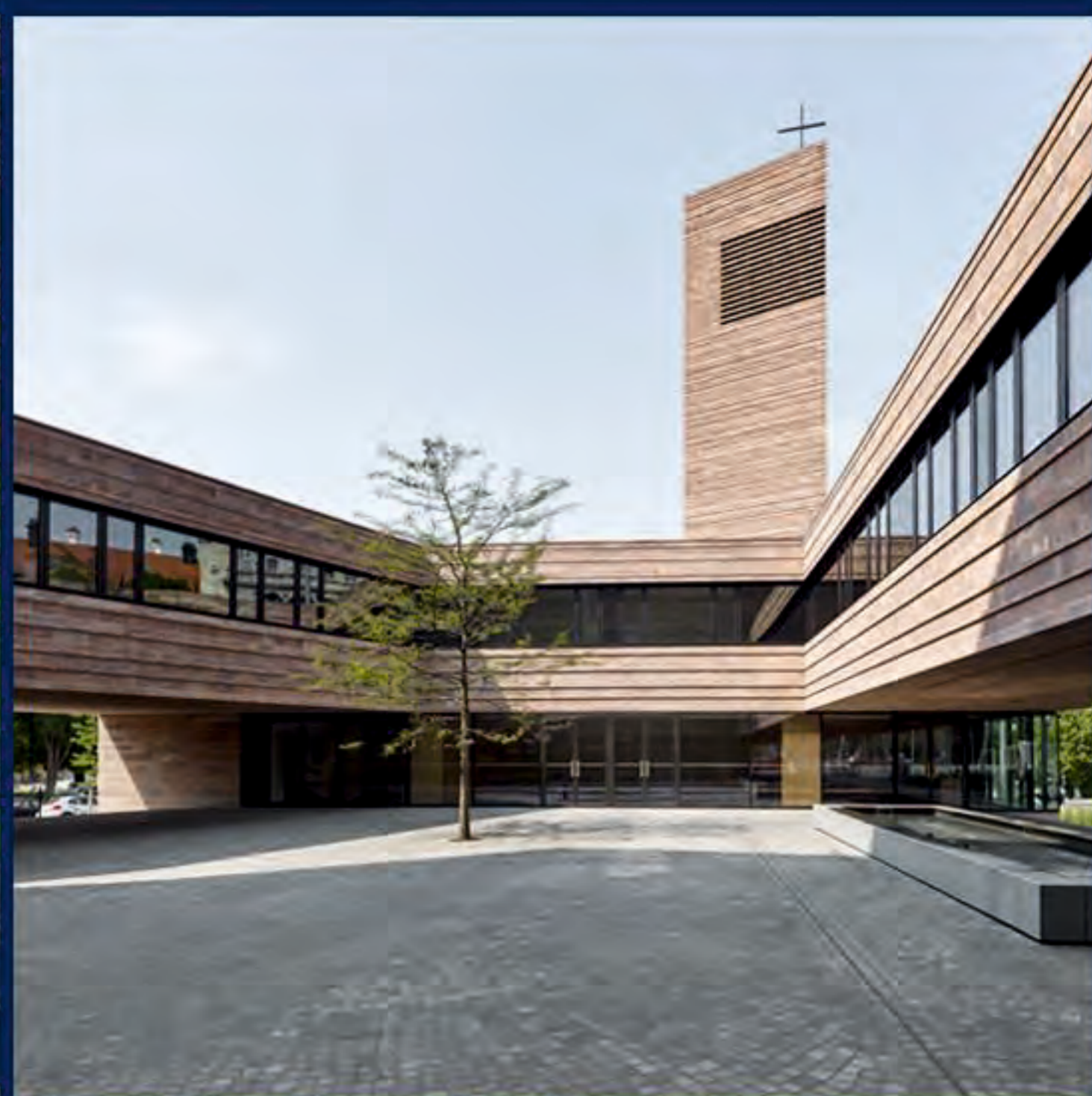
Leipzig / St. Trinitatis / Schulz und Schulz