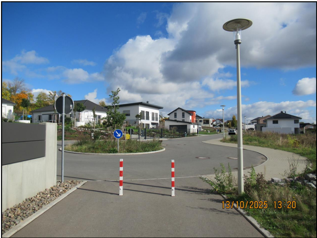
Endpunkt Wendekreis bei Hausnummer 38 und Übergang zu Marienthaler Höhe BÖW 1