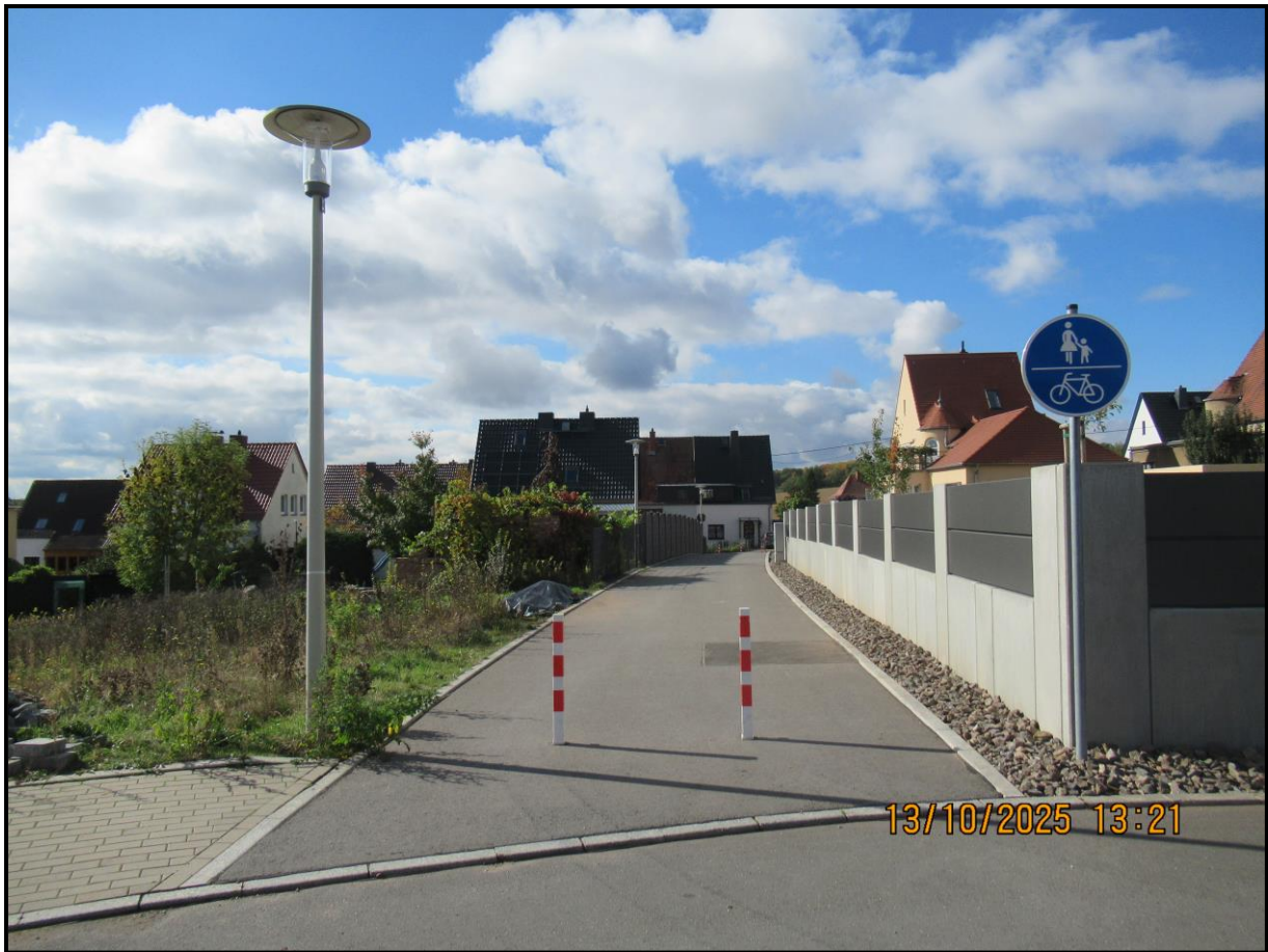
Anfangspunkt Marienthaler Höhe BÖW 1 bei Hausnummer 38