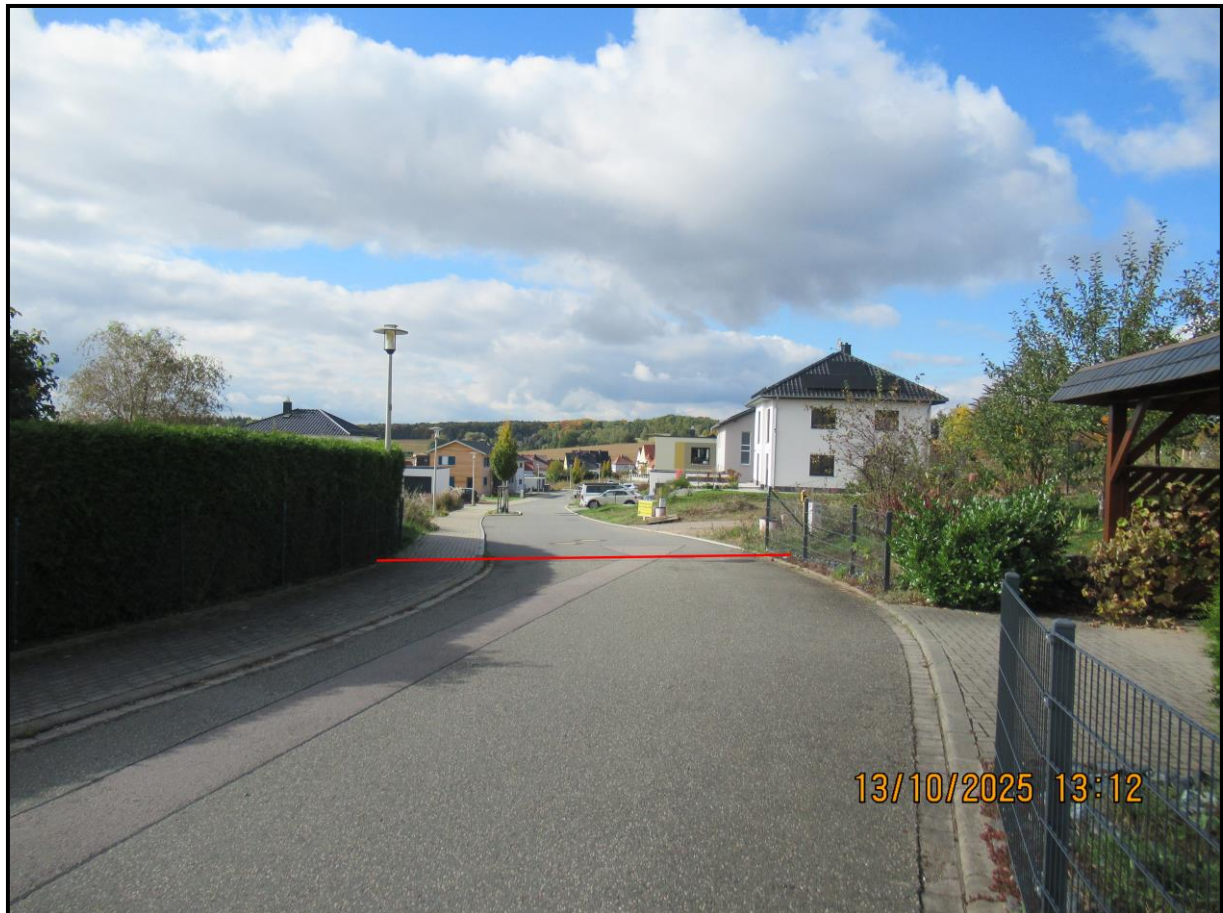
Anfangspunkt Marienthaler Höhe (rote Linie) bei Hausnummer 41

Anlage 2 – Fotodokumentation zur BV/157/2025 für den Bau- und Verkehrsausschuss am 3. November 2025 hier: Widmung der Verlängerung der Straße „Marienthaler Höhe“ – Ortsstraße und beschränkt-öffentlicher Weg (BÖW)