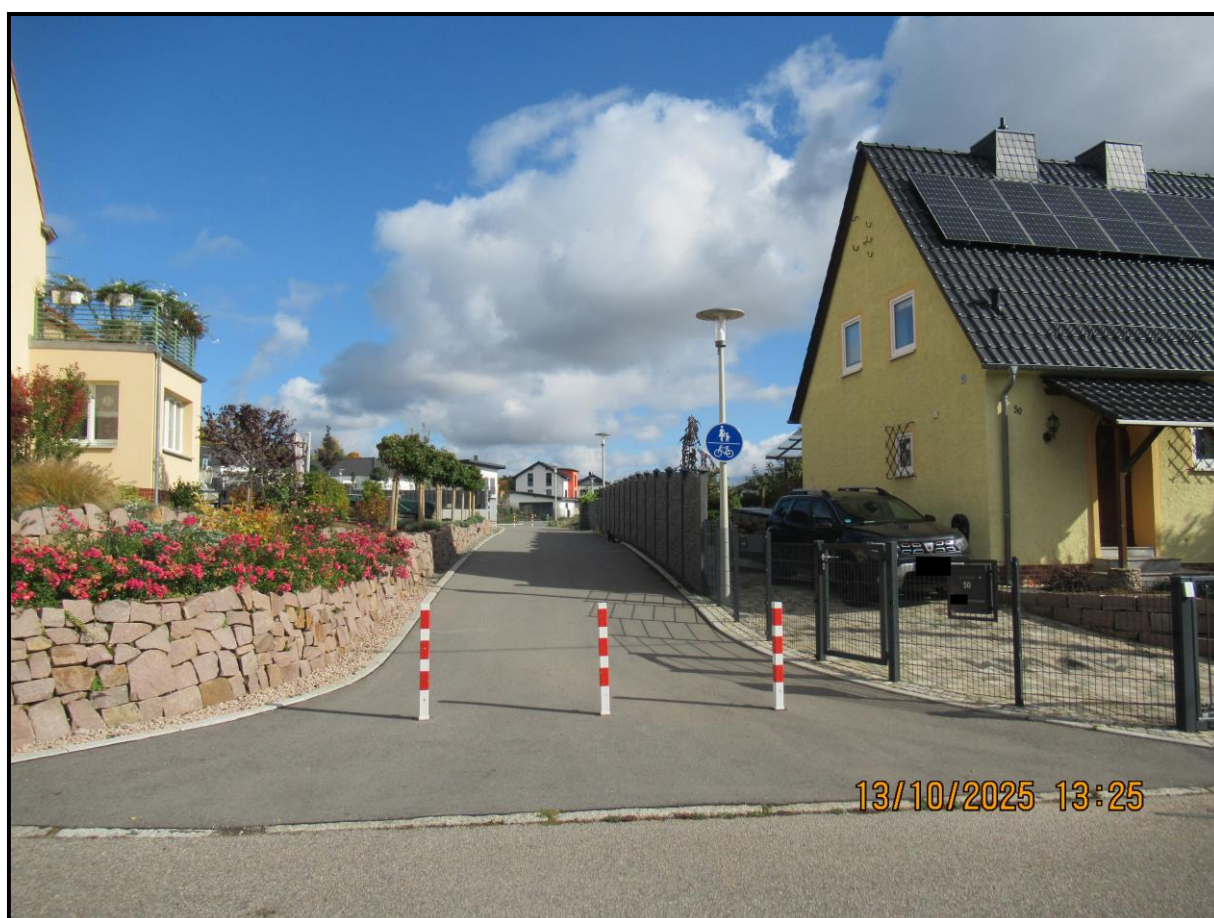
Endpunkt Ulmenweg zwischen Hausnummern 50 und 60