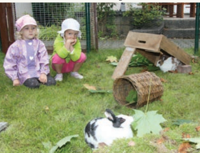
September 2017 Kaninchen bereichern Kita-Alltag in Gutwasserstraße