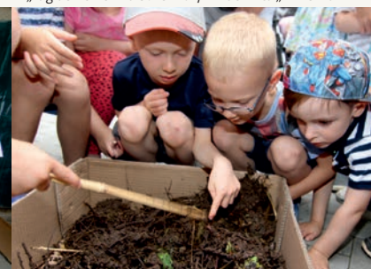
Juni 2017 „Tag der kleinen Forscher 2017“ in der Kita „Anne Frank“