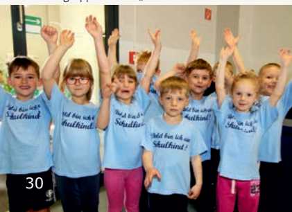
Mai 2017 Vorschulgruppe der Kita „Am Wasserturm“