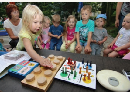
Juni 2017 „Tag der kleinen Forscher 2017“ in der Kita „Anne Frank“