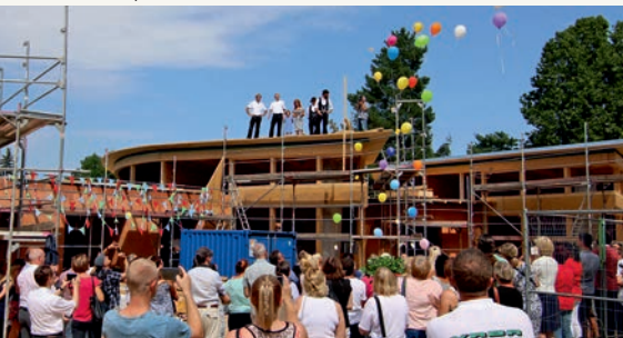
August 2017 Richtfest Kita „Apfelbäumchen“ des „Zwickauer Kinderhausverein“ e. V.