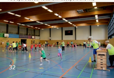
Mai 2017 ABC-Sportfest der Vorschulkinder, Sporthalle KKG