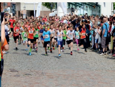
Mai 2017 Sparkassenlauf