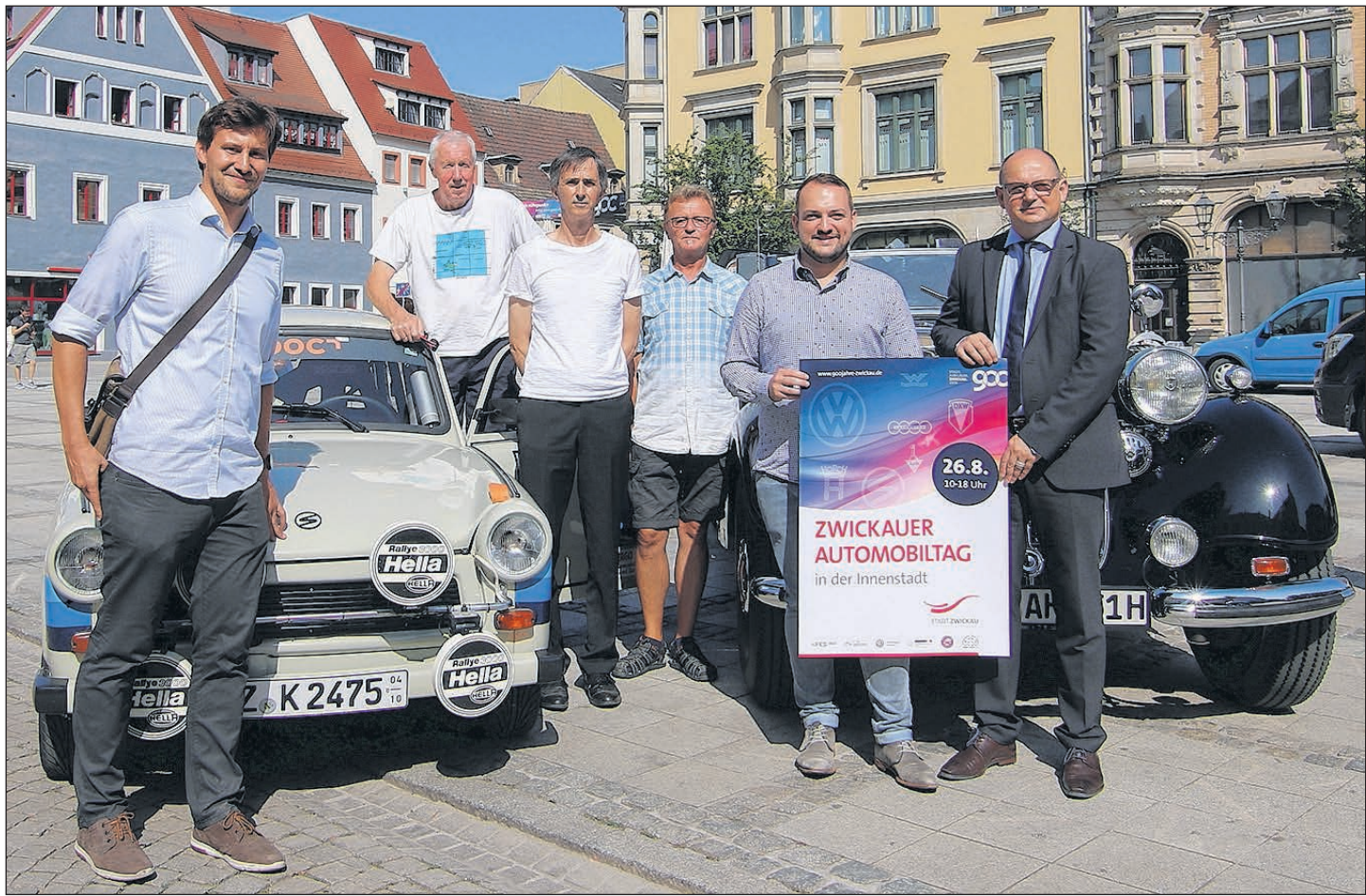
IM RAHMEN EINES PRESSEGESPRÄCHES INFORMIERTEN DIE ORGANISATOREN IN DER VERGANGENEN WOCHE ÜBER DIE HIGHLIGHTS DES ZWICKAUER AUTOMOBILTAGES, DER AM 26. AUGUST ZAHLREICHE AUTOMOBILFANS UND INTERESSIERTE IN DIE INNENSTADT LOCKEN SOLL.

SEITE 08 SACHSEN CLASSIC OLDTIMERRUNDFAHRT