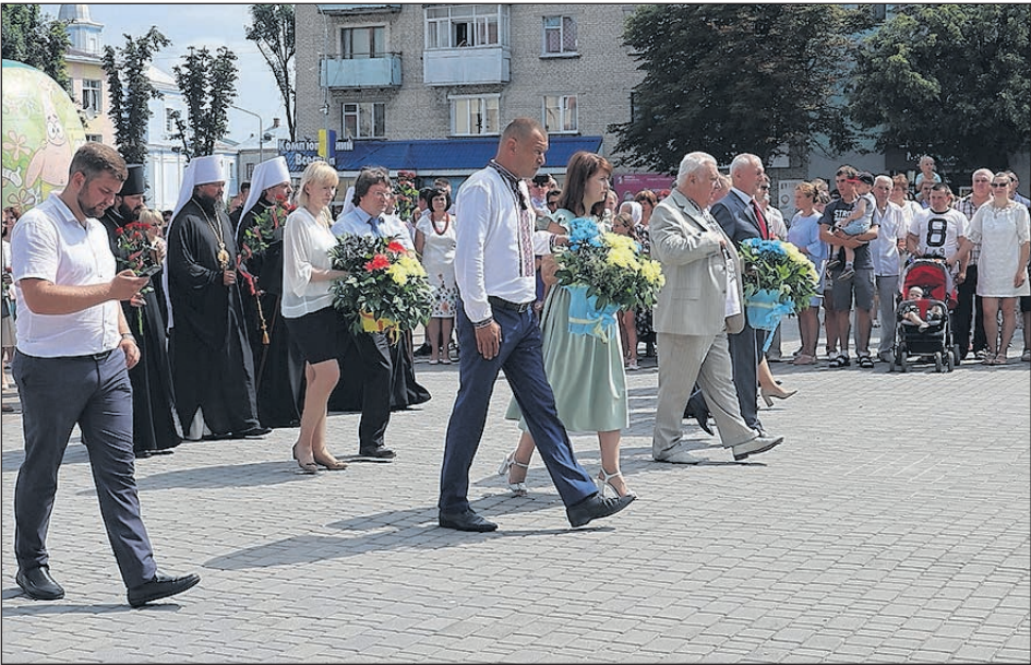
FEIERLICHE KRANZNIEDERLEGUNG FÜR DIE OPFER DER KRIEGE.