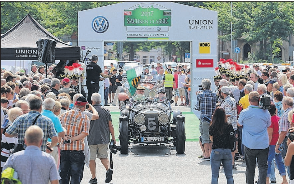
IN DEN VERGANGENEN JAHREN STARTETE DIE SACHSEN CLASSIC AUF DEM PLATZ DER VÖLKERFREUNDSCHAFT. NUN BILDET DER HAUPTMARKT DEN WÜRDIGEN RAHMEN FÜR DIE EINZIGARTIGE OLDTIMERUNDFAHRT.

Bereits zum 16. Mal macht sich Sachsens längstes Automobilmuseum auf den Weg. Rund 180 Klassiker und Youngtimer bis Baujahr 1998 nehmen an drei Tagen insgesamt 577 Kilometer unter die Räder. Hübsche Marktplätze und malerische Routen, oft gesäumt von Zuschauerspaliere, verleihen dieser Rallye ihr ganz spezielles Flair. Es lohnt sich, als Zuschauer einen der Rallye-Brennpunkte zu besuchen. Wo sonst hat man schon die Chance, acht Jahrzehnte Automobilgeschichte von den Zwanzigerbis zu den Neunzigerjahren in Aktion zu erleben? Oder fast noch besser: wenn sie in Reih und Glied parken und in aller Ruhe bestaunt werden können.