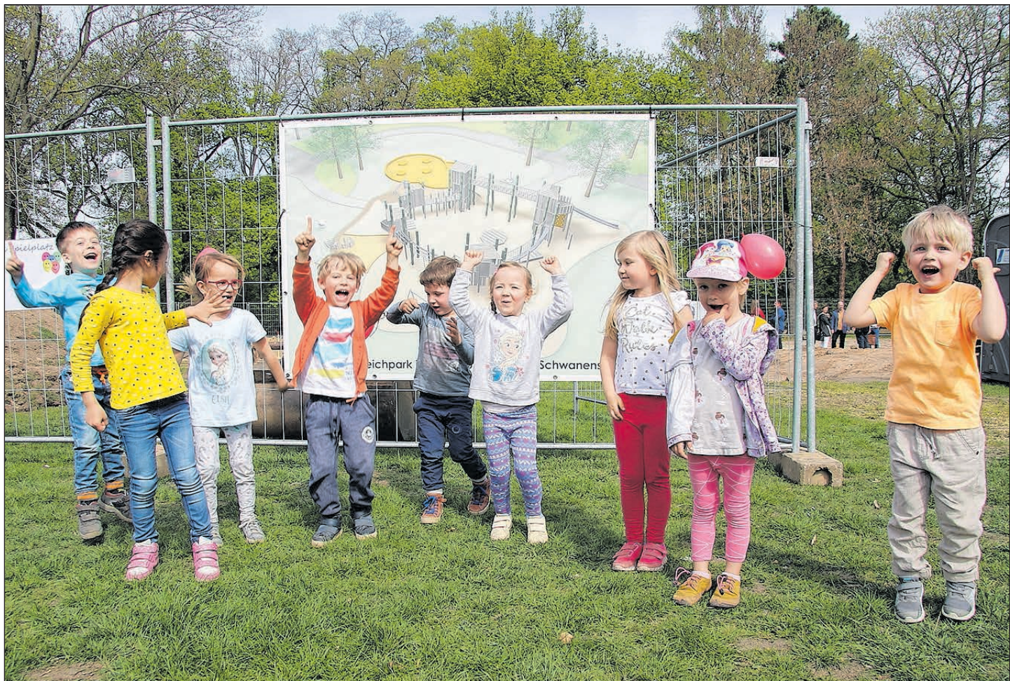
AM FREITAG ERFOLGTE AUF DER MELZERWIESE AM SCHWANENTEICH DER SYMBOLISCHE SPATENSTICH FÜR DEN SPIELPLATZ „SCHWANENSTADT“, DER BIS SOMMER DORT ENTSTEHT. BEI DEN KINDERN DER KITA GUTWASSERSTRASSE HERRSCHT BEREITS GROSSE VORFREUDE.

SEITE 05 ZWIKKOLÖR AM 4. MAI FEST UND KONZERT