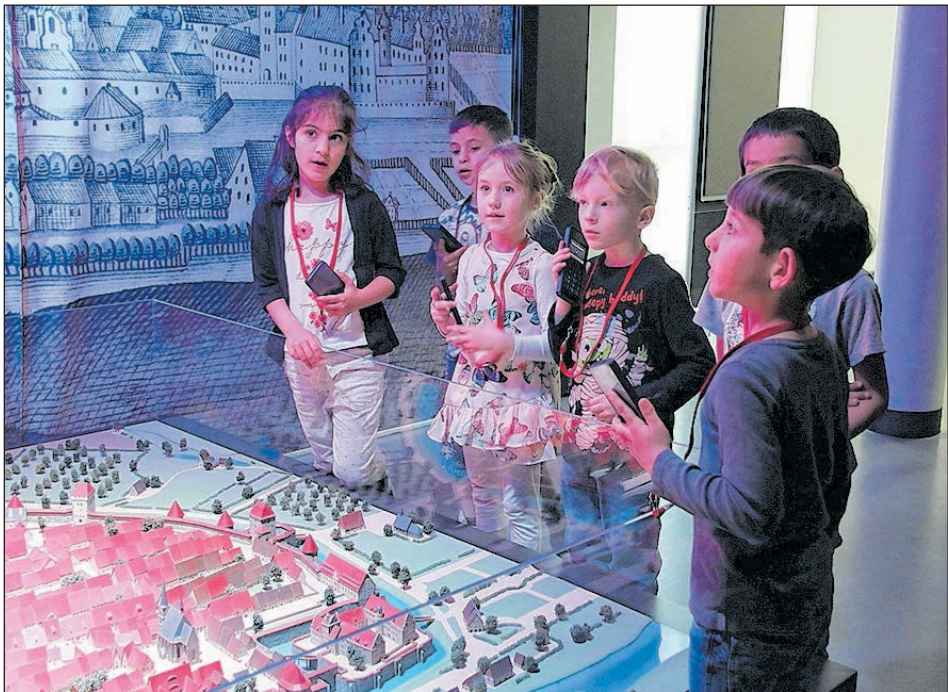
KINDER DER KITA STADSTROLCHE DURFTEN AM VERGANGENEN DONNERSTAG ALS ERSTE DIE NEUEN GERÄTE IN DEN PRIESTERHÄUSERN ZWICKAU TESTEN.