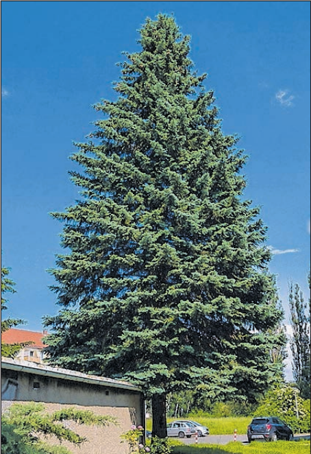
BAUM A IST EINE CA. 18 METER HOHE BLAUFICHTE AUS ZWICKAU-MARIENTHAL

Von Mai bis Juli waren alle Zwickauer aufgerufen, sich in Grundstücken, Gärten, bei Verwandten und Nachbarn nach einem besonders schön gewachsenen Nadelbaum umzusehen und ihre Vorschläge einzureichen. Insgesamt gingen acht Bewerbungen ein, fünf Bäume kamen in die engere Auswahl und wurden gemeinsam mit dem Landwirtschaftsunternehmen Jacob besichtigt. Darunter waren Bäume aus Klingenthal, Stützengrün, Zwotental im Vogtland und Zwickau. Die zwei schönsten Exemplare für den Zwickauer Weihnachtsmarkt wurden aus diesen ausgewählt. Aufgrund des großen Interesses in den vergangenen Jahren sollen auch in diesem Jahr alle Zwickauer wieder mitentscheiden, welcher der beiden Bäume dieses Jahr den Hauptmarkt schmücken soll. Baum A ist eine ca. 18 Meter hohe Blaufichte aus Zwickau-Marienthal. Baum B ist eine ebenfalls ca. 18 Meter hohe Douglasie aus Zwotental im Vogtland. Die beiden zur Wahl stehenden Bäume sind etwa 40 Jahre alt.