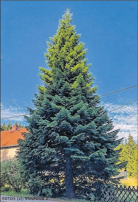
BAUM B IST EINE CA. 18 METER HOHE DOUGLASIE AUS ZWOTENTAL IM VOGTLAND.

Die Abstimmung läuft seit Montag bei Facebook https://www.facebook.com/ZwickauerWeihnachtsmarkt/ oder per Postkarte an die Kultour Z. GmbH, Hauptstraße 6, 08056 Zwickau (Tourist Information). Einsendeschluss ist der 9. August 2019.