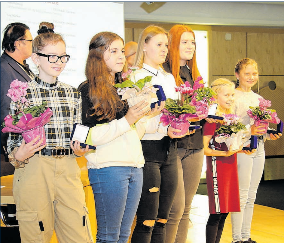
DIE INSGESAMT 122 EHRUNGEN SPIEGELN DAS ERFOLGREICHE ABSCHNEIDEN DER ZWICKAUER SPORTLER IN VERGANGENEN WETTKAMPFJAHR WIDER.