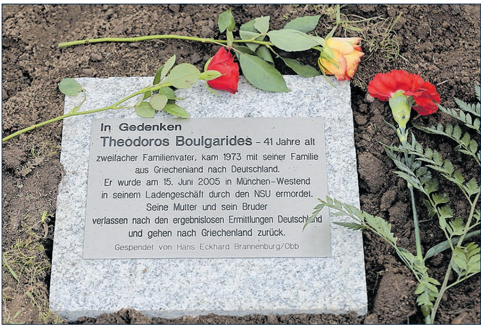
AM GEDENKORT ERINNERN GEDENKTAFFELN AN DIE MENSCHEN, DIE VON DEN RECHTSTERRORISTEN DES NSU ERMORDET WURDEN.

Die Bäume – vornehmlich Eichen, aber auch Ahornbäume und eine Blutbuche – konnten ebenso wie die Gedenktafeln komplett aus Spenden finanziert werden. Zu diesen hatte die Stadt aufgerufen, nachdem Anfang Oktober der erste Gedenkbaum abgesägt worden war. Insgesamt gingen bisher fast 14.000 Euro ein. Zu den Spendern gehören Privatpersonen aus Zwickau ebenso wie aus ganz Deutschland, Unternehmen ebenso wie Institutionen. Gespendet haben beispielsweise die DPFA Akademiegruppe, die Gebäude- und Grundstücksgesellschaft Zwickau mbH (GGZ), die Zwickauer Ener-