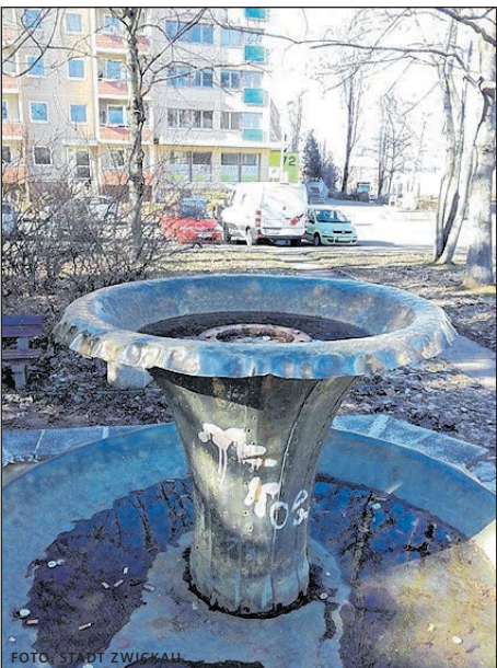
DER KELCHBRUNNEN IN NEUPLANITZ.

Die zweiteilige Skulptur in Form eines Kelches stammt noch aus DDR-Zeiten (ca. Anfang der 1980er Jahre) und ist nach dem Rückbau in Neuplanitz weder zweckmäßig noch entspricht sie den heutigen Sicherheitsanforderungen. Auch eine Instandsetzung ist aus fachlicher Sicht nicht mehr möglich. Die Brunnenanlage wird daher komplett abgebaut und eingelagert. Im Anschluss an diese Arbeiten werden im Umfeld der Anlage die Flächen entsiegelt, Hohlräume verfüllt und der Boden modelliert. Mit dem Einbringen von geeigneten Substrat, dem Pflanzen von Bäumen und der Anlage einer neuen Rasenfläche werden die Bauarbeiten voraussichtlich Ende Februar abgeschlossen.