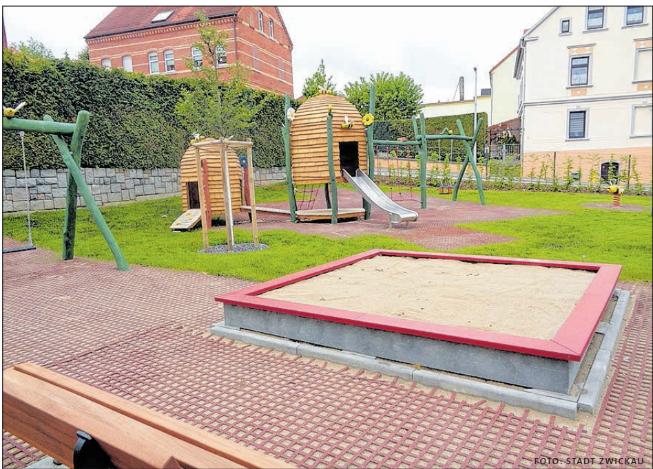
NACHDEM DER RASEN ANGEWACHSEN IST, KANN DER SPIELPLATZ NUN GENUTZT WERDEN.

Neu gepflanzt wurden außerdem ein Kirschbaum und eine Hainbuchenhecke. Mit der Fertigstellung des Areals konnte den Vorgaben aus dem Stadtentwicklungs- und Fördergebietskonzept für das Stadtumbaugebiet „Nieder-/Oberplanitz 2012 – Fortschreibung 2018“ gefolgt werden. Der für diese Maßnahme genutzte Programtteil „Aufwertung“ innerhalb der Städtebauförderung hat es sich u. a. zur Aufgabe gemacht, städtebauliche Missstände und Funktionsverluste nachhaltig zu mildern und die städtebaulichen Strukturen der Ortsteilzentren als kompakte und soziale Stadtbereiche zu entwickeln. Das ist hervorragend gelungen. Bei insgesamt zuwendungs-fähigen Ausgaben und Kosten in Höhe von 100.000 Euro werden zwei Drittel an Zuwendungen ausgereicht. Der städtische Anteil beträgt demnach 33.333,33 Euro.