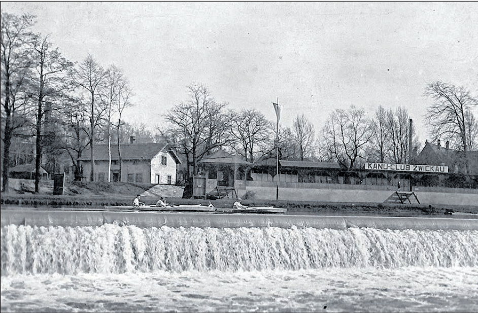
BOOTSWEIHE, OKTOBER 1926.

darf ein kleiner Überblick über die Wettkampffregeln. Dass die Zwickauer Sportler, trotz oft schwieriger Trainingsbedingungen, die auch mit den wechselnden Wasserständen der Mulde zusammenhängen, sehr erfolgreich waren, zeigt ein Blick auf die Medaillen-Gewinner aus Zwickau. Für die Schau stellen u. a. private Leihgeber, der Kanu-Club Zwickau e. V., die SG Kanu Meißen e. V., die SG Spremberg e. V. Abteilung Kanu, das Stadtgeschichtliche Museum Leipzig und das Stadtarchiv Zwickau besondere Objekte als Leihgaben zur Verfügung.