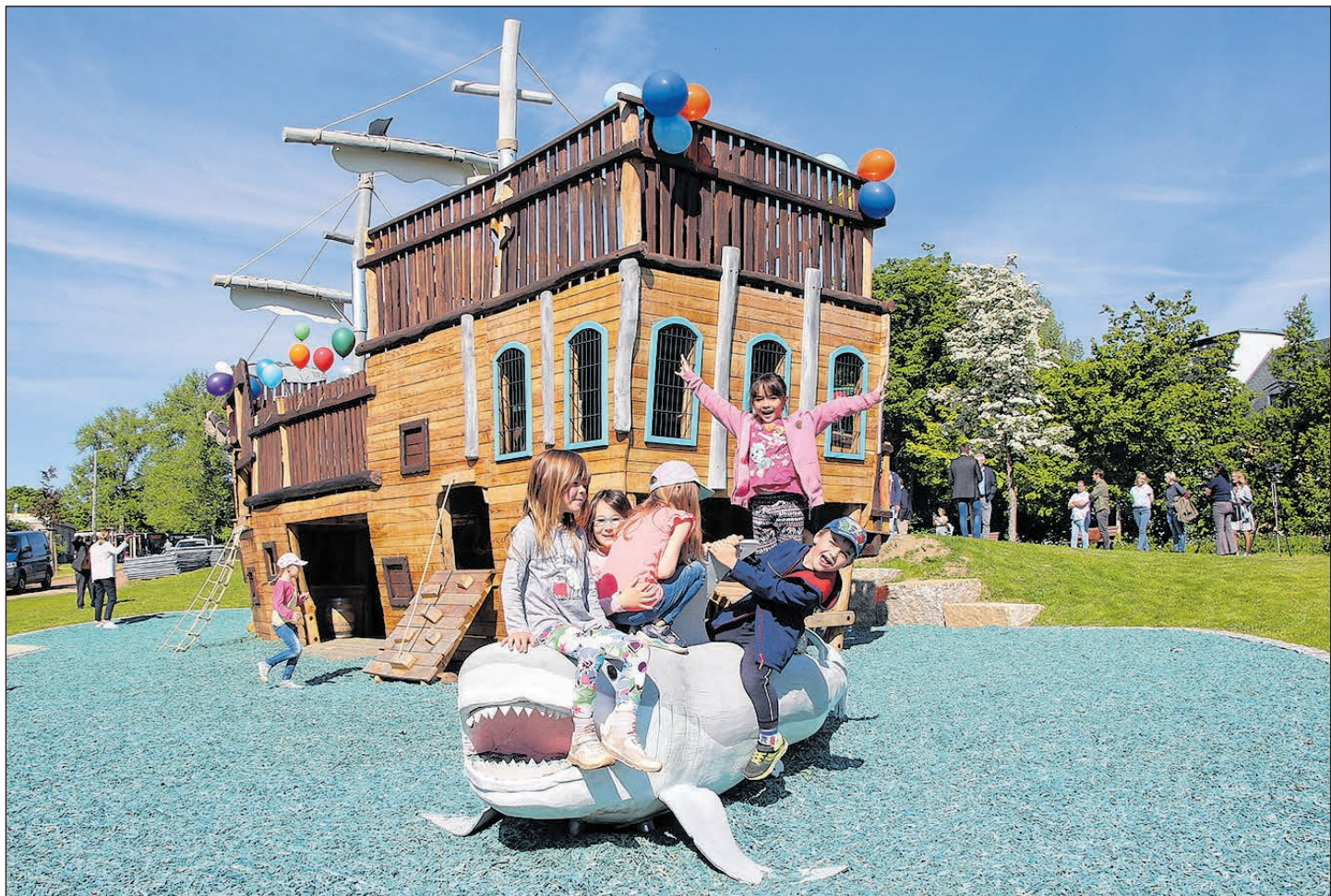
DAS ELF METER LANGE PIRATENSCHIFF AN DER BACHSTRASSE WURDE PÜNKTLICH ZUM KINDERTAG EINGEWEIHT.