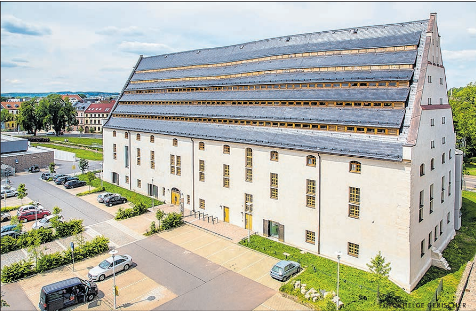
DIE STADTBIBILOTHEK IM KORNGHAUS FREUT SICH AUF IHRE BESUCHER.

Das ist beim Besuch dieser beiden Einrichtungen zu beachten: Vorherige Terminbuchung. Es besteht die Pflicht zum Tragen einer medizinischen oder FFP 2-Maske im gesamten Gebäude. Der Mindestabstand muss eingehalten werden. Die Hände müssen vor Betreten der Einrichtung desinfiziert werden. Es besteht Kontaktnachverfolgung und bei Krankheitssymptomen sollte man bitte zu Hause bleiben. Ein tagesaktueller Negativtest ist für die Nutzung des Lesesaals nicht notwendig.