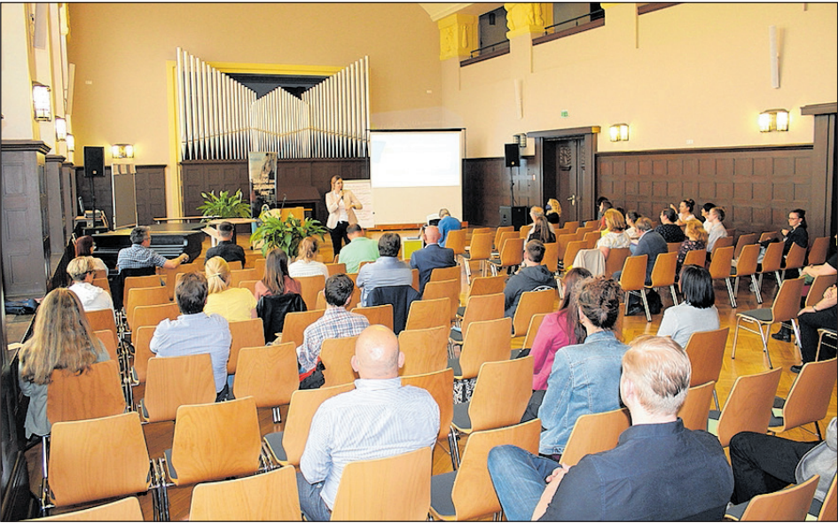
AM 20. JULI FAND DIE DIALOGVERANSTALTUNG MIT MEHR ALS 50 GELADENEN GÄSTEN IN DER AULA DES KÄTHE-KOLLWITZ-GYMNASIUMS STATT.

Bereits zur Dialogveranstaltung wurde festgehalten, dass eine Arbeitsgruppe sowohl die Ergebnisse der Selbstanalyse als auch der Dialogveranstaltung genau analysieren und auswerten wird. Gemeinsam mit allen beteiligten Akteuren soll erarbeitet werden, welche Maßnahmen, Entscheidungen und Entwicklungen umgesetzt werden können, welche in das kommende Stadtentwicklungskonzept einfließen werden und bei welchen Ansätzen wir die Unterstützung von Bund und Land benötigen. Weitere Ideen und Unterstützungen in dieser Arbeit sind gern gesehen.