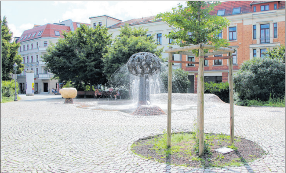
DER SCHUMANNPLATZ ERHÄLT IM NÄCHSTEN JAHR ÜBER DEN BÜRGERHAUSHALT WEITERE SITZGELEGENHEITEN IM WERT VON 10.000 EURO.