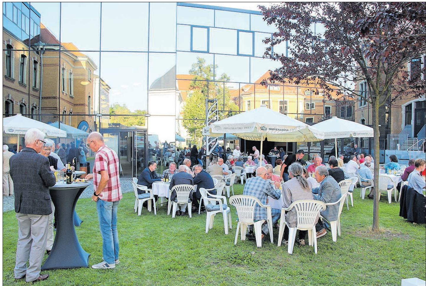
OHNE EHRENAMTLICHES ENGAGEMENT IST DIE ARBEIT IN VIELEN VEREINEN, EINRICHTUNGEN UND INSTITUTIONEN NICHT ZU LEISTEN. UM DIE ARBEIT DER EHRENAMTLICHEN BÜRGERINNEN UND BÜRGER ZU WÜRDIGEN, LUD DIE OBERBÜRGERMEISTERIN AM VERGANGENEN FREITAG VERSCHIEDENE AKTEURE ZU EINEM SOMMEREMPANG EIN. MEHR ALS 60 EHRENAMTLICH TÄTIGE ZWICKAUERINNEN UND ZWICKAUER FOLGTEN DER EINLADUNG. IM RAHMEN DER VERANSTALTUNG IM INNENHOF DES ROBERT-SCHUMANN-KONSERVATORIUMS BEDANKTE SICH DIE OBERBÜRGERMEISTERIN BEI DEN EINGELADENEN FÜR IHRE SOLIDARISCHE UND GEMEINNÜTZIGE ARBEIT.