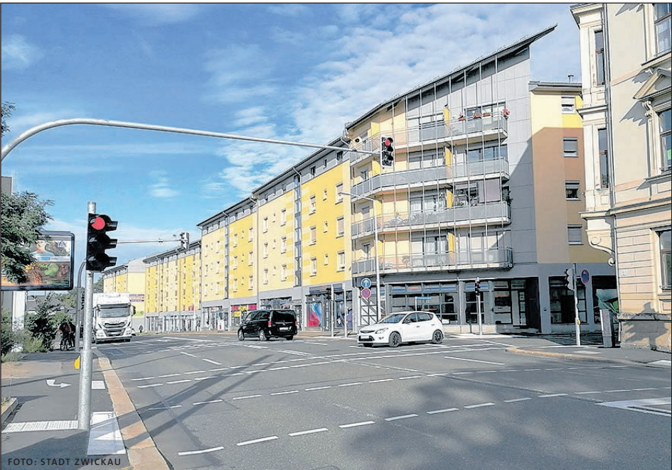
AN DER KREUZUNG REICHENBACHER STRASSE/GUTWASSERSTRASSE WURDE EINE LICHTSIGNALANLAGE INSTALLIERT. BIS ENDE 2022 WIRD SICH ZEIGEN, OB ES DORT WENIGER UNFLLE GIBT.

► Erfassen von Unfllen Verkehrsunfalldaten werden durch die Polizei im Rahmen der Verkehrsunfallaufnahme erfasst und entsprechend aufbereitet. Dazu legt die Polizei Unfalltypenkarten und -aufzeichnungen an. In den Karten wird jeder Verkehrsunfall genau markiert und mittels Farbigkeit jeweils einem Unfalltyp (Fahrerunfall, Abbiege-Unfall, Einbiegen/Kreuzen-Unfall, berschreiten-Unfall, Unfall durch ruhenden Verkehr, Unfall im Lngsverkehr, Sonstiger Unfall) und -kategorie (Konfliktvorgang, Gettete, Schwer- und Leichtverletzte sowie Sachschaden) zugeordnet. Damit wird ersichtlich, wo sich Unflle hufen bzw. ggf. weitere Unfallursachen (Alkohol-, Wildunfall) und -arten (Aufprall auf Pfeiler, Fugnger, Radfahrer) aufzeigen. Jeder Unfall wird zudem schriftlich erfasst. Diese Aufzeichnungen enthalten ausfhrliche Daten, u. a. zum Unfallhergang, dem Straenzustand, Angaben zur Witterung und den Sichtverhltnissen, um nur einige zu nennen.