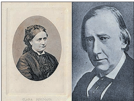
CLARA SCHUMANN UND CHARLES HALLÉ.

In der 14. Auflage dieser historischen Konzerte, das ursprünglich schon für 2020 geplant war, wird – wiederum pandemiebedingt – im Unterschied zu den Schumann-Galas der Vergangenheit das Programm eines Kammerkonzertes wiederaufgeführt, das Clara Schumann am 22. März 1872 gab. Sie spielte damals gemeinsam mit dem Geiger und Freund Joseph Joachim, dem englischen Pianisten Charles Hallé, dem italienischen Cellisten Alfredo Piatti und englischen Musikern in London. Erstmals konzertierte Clara Schumann 1856 in England. Bis 1888 hielt sie sich insgesamt 19 Mal zu Konzerttourneen dort auf und spielte allein 200 Konzerte in der neuen St. James's Hall mit ihren 2000 Plätzen. Auf dem Programm stehen Robert Schumanns Arabeske op. 18, die Novellette op. 21/1 und Fünf Stücke im Volkston für Cello und Klavier op. 102, in denen nordische, ungarische, südländische und deutsche Volksweisen zu betörenden Cello-Miniaturen verwoben sind. Zu hören sind außerdem Beethovens Septett für Holzbläser und Streicher, eine Arie aus Figaros Hochzeit von Mozart, Lieder von Mendelssohn Bartholdy, Kompositionen für Klavier und Violine Johann Sebastian Bachs und seines Zeitgenossen Jean-Marie Leclair. Zum Abschluss wird das Konzert für zwei Klavier c-moll BWV 1062 von Johann Sebastian Bach zu hören sein – eine Bearbeitung des d-Moll Konzertes für zwei Violinen BWV 1043.