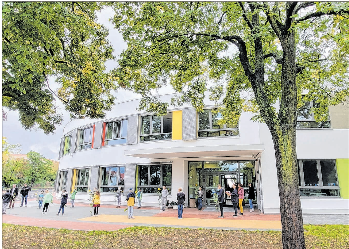
EINE RUNDE SACHE: DER NEUBAU DES FÖRDERZENTRUMS MIT DEM FÖRDERSCHEWERPUNKT SPRACHE.

SEITE 06 VORBEREITUNGEN FÜR STADTLAUF AUF DER ZIELGERADEN VERANSTALTER HOFFEN AUF MEHR ALS 1.000 TEILNEHMER