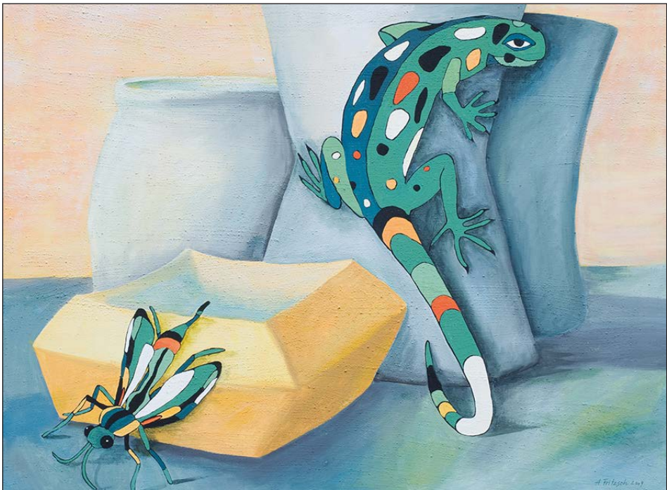
ANNETTE FRITZSCH: VON ANDERER ART IV, ACRYL, 2009 (AUSSCHNITT)

Parallel dazu wird vom 2. Oktober bis zum 27. November 2022 auch eine neue Ausstellung im Kabinett der Galerie am