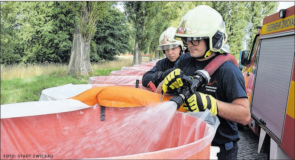
BEFÜLLEN DES AQUARIWA-SYSTEMS AN DER CROSSENER STRASSE.

Etwa 150 Einsatzkräfte probten am 10. September den Aufbau verschiedener mobiler Hochwasserschutzsysteme. Nils Eichhorn, Leiter des Feuerwehramtes, zeigt sich in einem ersten Resümee zufrieden: „Alle Beteiligten haben gut und engagiert gearbeitet, der Aufbau der mobilen Systeme hat geklappt!“ Von der Übung hatte sich auch Oberbürgermeisterin Constance Arndt vor Ort einen Eindruck verschafft.