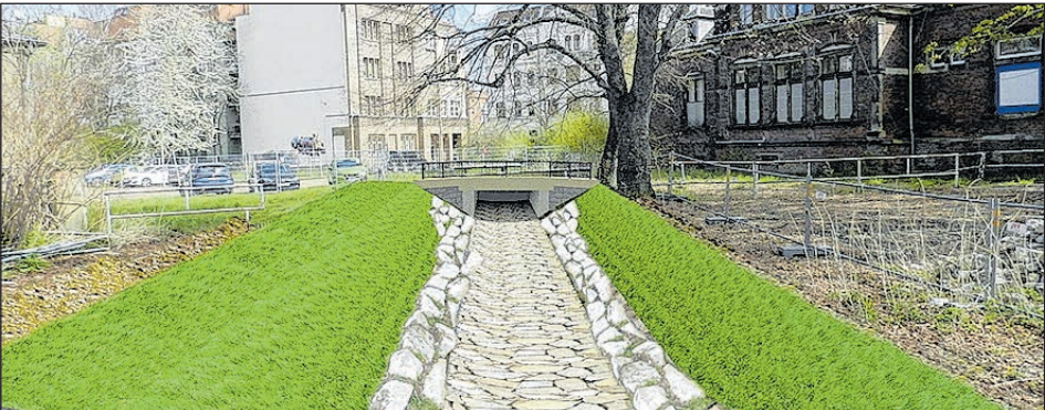
PLANUNG ZUR RENATURIERUNG DES MORITZBACHES, MIT BLICKRICHTUNG POETENWEG.

Die Gesamtmaßnahme soll 2023 und 2024 realisiert werden. Die Kosten sind mit gut 1,3 Mio. Euro veranschlagt. Der Abschnitt des Moritzbaches ist gut 70 Meter lang und verläuft im Areal des ehemaligen Georgengymnasiums. Aktuell ist er komplett überbaut. Diese Überbauung befindet sich in einem schlechten, teils desolaten Zustand, so dass einzelne Bereiche aus Sicherheitsgründen bereits abgesperrt sind. Hinzu kommt das Hochwasserrisiko: Der Abfluss des Gewässers ist bei Stark-regen oder Hochwasserereignissen durch den ungenügenden Bauwerkszustand nicht mehr unbedingt gewährleistet. Zur Umsetzung der Ziele der EU-Wasser-rahrahmenrichtlinie, koordiniert mit der künftigen Nutzung der ehemaligen Schule