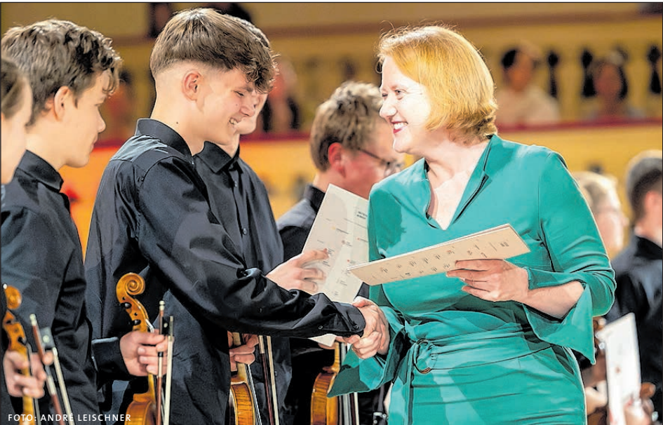
BUNDESFAMILIENMINISTERIN LISA PAUS ZEICHNETE BEIM PREISTRÄGERKONZERT AM 30. MAI IM KONZERT- UND BALLHAUS „NEUE WELT“ DIE ERFOLGREICHEN JUNGEN MUSIKER AUS.