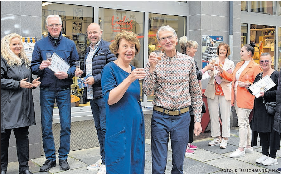
DIE GESCHÄFTSINHABER HABEN DIE ZWICKAUER UND IHRE GÄSTE MUSIKALISCH IN UNSERER STADT WILLKOMMEN GEHEISSEN.

„Kunsthandwerk Liebig“ ist Sieger des Schaufensterwettbewerbs „Schau an! Zwickau musiziert“ vom 23. bis 31. Mai. Mit einer stimmungsvollen Komposition konnte sich das Traditionsgeschäft vor 16 Mitbewerbern platzieren. In Anlehnung an den zeitgleich stattfindenden Bundeswettbewerb „Jugend musiziert“ wurden unglaublich viel Fantasie, hohe Umsetzungsfreude und vielfältige musikalische Verbindungen zur Schau gestellt.