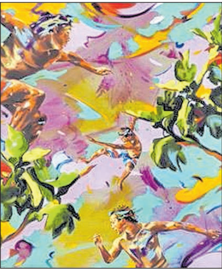
IM FREIEN, 2023, OIL ON CANVAS

Norbert Bisky, der zu den international bekanntesten und profiliertesten Künstlern zählt, hat für diese Ausstellung und Zwickau einen Werkzyklus zum Thema Max Pechstein geschaffen, 17 neue Bilder sind zu sehen. Unter dem Titel „Im Freien“ zeigt Norbert Bisky in der Ausstellung nun also eine Gruppe neuer Arbeiten auf Leinwand und Papier, die in assoziativer Auseinandersetzung mit dem Gesamtwerk Max Pechsteins (*1881 in Zwickau) entstanden sind.