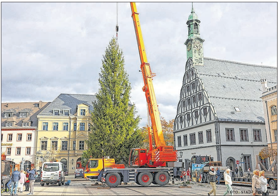
DIE 40 JAHRE ALTE FICHTE STAND AN DER ALTEN ASCHBERGSCHANZE IN KLINGENTHAL.

► Schlossweihnacht an allen vier Adventswochenenden Am ersten Adventswochenende öffnet auch die Schlossweihnacht ihre Pforten. In und um Schloss Osterstein gibt es Händler und Schauhandwerker, beheiztes Märchenkino, Kinderkarussell, Live-Pro-