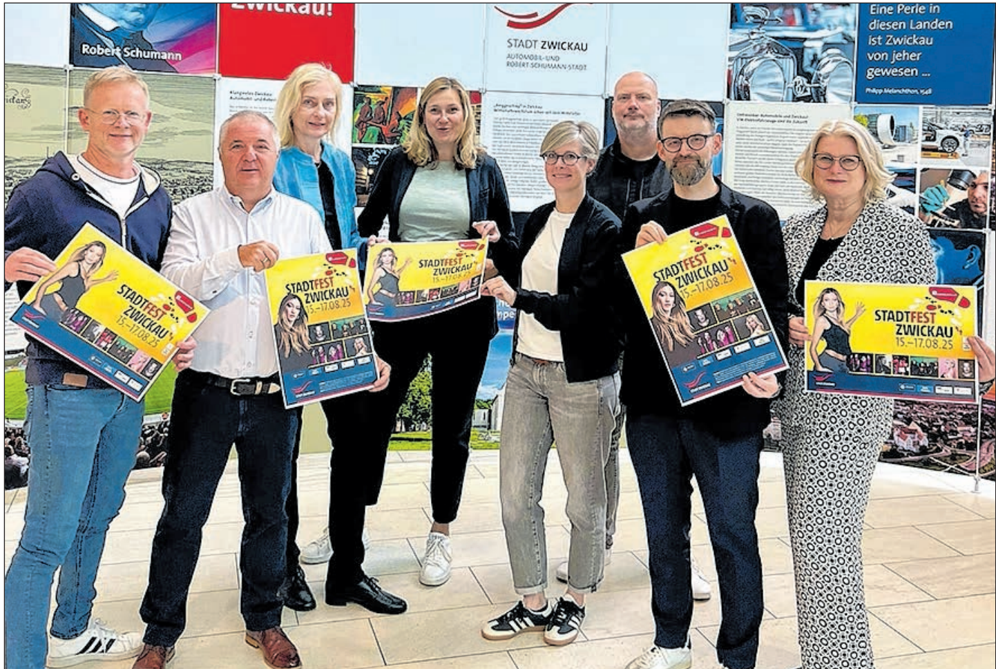
DAS STADTFEST-ORGANISATIONSTEAM STELLTE AM 22. MAI IM RATHAUS DAS PROGRAMM ZUR SOMMERSAUSE 2025 VOR.

SEITE 04 SCHUMANN-FEST VOM 5. BIS 15. JUNI: CLARA & CO. KOMPONISTINNEN AUS FÜNF JAHRHUNDERTEN