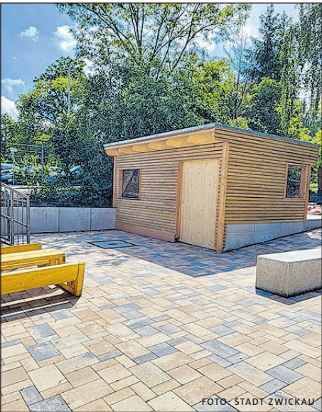
DAS SCHICKE NEUE GARTENHAUS IST EIN ECHTES HIGHLIGHT.

Mitte Mai war Bauabnahme und anschließend Freigabe. Markant ist vor allem der neue Kletterturm mit Kletternetz, Leiter, Stangen und Seil, der von den Kindern sofort in Beschlag genommen wurde. Jubel gabs auch über neues Sandkastenspielzeug, Schubkarren und eine neue Matschküche, die dank einer Restcent-Spende von Volkswagen Sachsen zusätzlich angeschafft werden konnten. Das Team und die Kinder der I-Kita Sputnik sagen auf diesem Wege noch einmal recht herzlich Danke! In der 3000 Quadratmeter großen Außenanlage ist jetzt – Dank der Sanierung – vieles wieder schick, aufgewertet und kann ausgelassen gespielt werden. Im Rahmen der Baumaßnahme wurden u. a. störendes