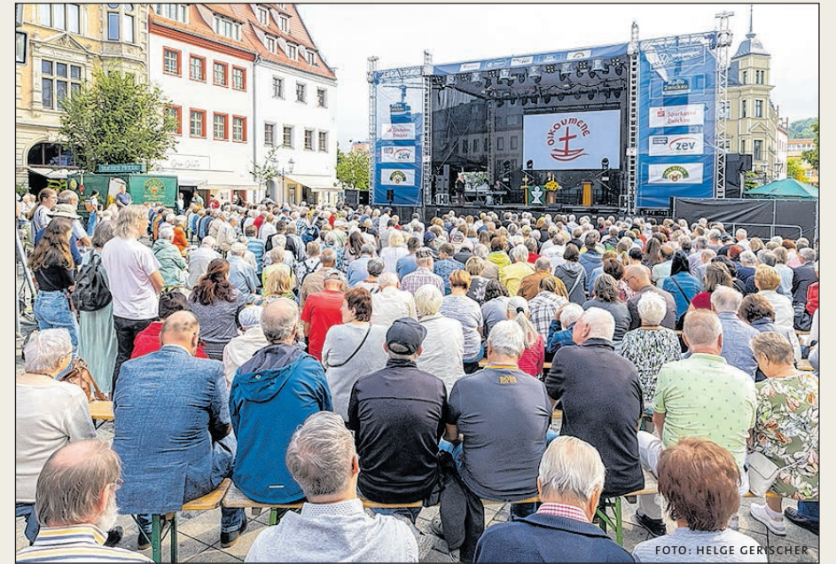
DER ÖKUMENISCHE GOTTESDIENST FINDET AM STADTFESTSONNTAG STATT.

Bühnenprogramme ohne ortsansässige bzw. regionale Vereine? Undenkbar! Zur Riesensause gehören sie unbedingt dazu, denn die Grundidee zum Stadtfest Zwickau wurde aus dem „Tag der Sachsen“ im Jahr 2000 in der Automobil- und Robert-Schumann-Stadt geboren und dieser war ein Fest der Vereine und Verbände.