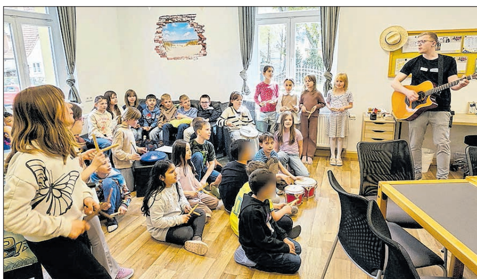
DIE HORTKINDER BEDANKTEN SICH SINGEND MIT EINEM OHRWURM.

Nach Abschluss der Arbeiten profitieren nun insbesondere die Hortkinder von deutlich verbesserten Bedingungen. Im Zuge der Sanierung wurden eine neue Heizungsanlage sowie moderne Sanitärbereiche für alle Altersklassen geschaffen, einschließlich eines barrierefreien Behinderten-WCs. Ergänzt wurden die Maßnahmen u. a. durch neue Fußböden, verbesserten Schallschutz und umfassende Malerarbeiten. Außerdem gab es auch Anpassungsarbeiten im Krippenbereich: Neben neuen Fußböden und Malerarbeiten erfolgte hier der Einbau einer Fäkalien-spüle und eines Krippen-WCs im Vorraum der beiden Krippengruppen. Um den liebevollen Feinschliff kümmern sich die Erzieherinnen und verwandeln die sanierten Zimmer in zauberhafte