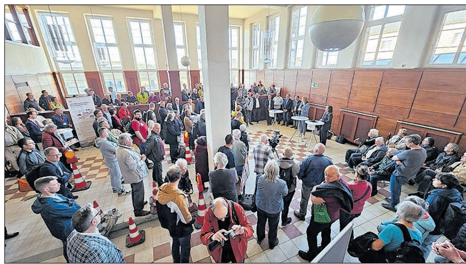
ZAHRLICHE INTERESSIERTE NAHMEN AM 23. APRIL AN DER INFORMATIONSVERANSTALTUNG IN DER EHEMALIGEN MITROPA DES HAUPTBAHNHOFES TEIL.

Zwickau stellt die Weichen für eine umfassende Modernisierung seiner Infrastruktur. Bereits im November 2023 fasste der Stadtrat einen Grundsatzbeschluss für ein weitreichendes Investitionspaket, das zahlreiche Projekte bis zum Jahr 2030 bündelt. Ziel ist es, die Stadt zukunftsfähig aufzustellen und die Lebensqualität nachhaltig zu verbessern.