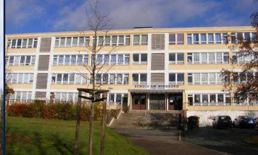
Sanierung R. Weiß-Schule Ergänzung Photovoltaik