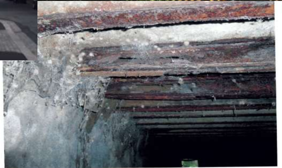
5 Zustand Deckenträger am Auflager, Komplettdurchrostung