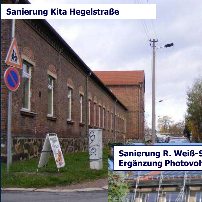
Sanierung Kita Hegelstraße