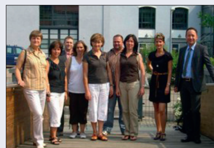
Teilnehmer der Lehrerakademie mit Vertretern von ZEV und Wirtschaftsförderung beim Rundgang auf dem Betriebsgelände

>>> Mehr Informationen unter: www.schule-wirtschaft-sachsen.de