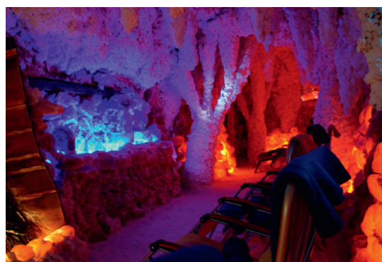
Wellness-Oase in Zwickauer Innenstadt

>>> Mehr zum Thema unter: www.salzgrotte-zwigge.de