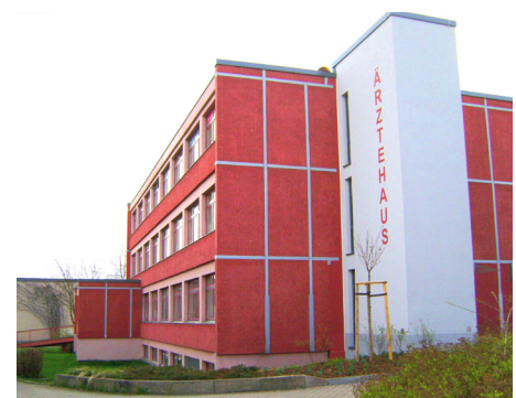
Außenansicht, Vorderseite mit Aufzug