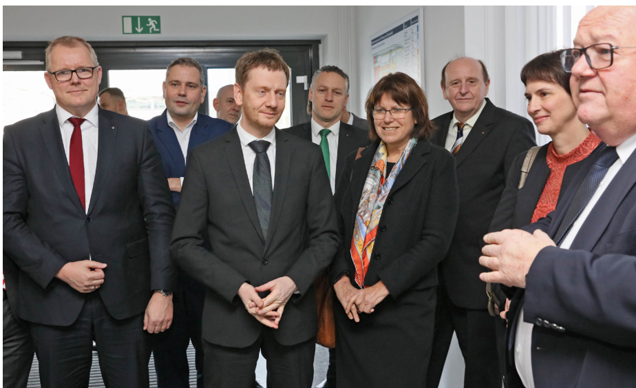
Antrittsbesuch von Ministerpräsident Kretschmer am 22. Januar 2018, Foto: Ralph Köhler/propicture