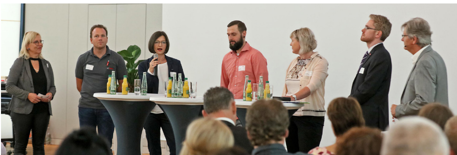
Podiumsdiskussion während der Veranstaltung

Telefon: 0375 838006 wirtschaftsfoerderung@zwickau.de