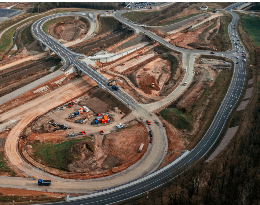
Luftaufnahme der Baustelle an der B 175

Nach Beginn der Baumaßnahme durch Baufeldfreimachungsarbeiten und anschließender Errichtung einer Baustellenumfahrung im Jahr 2015 liegen die derzeitigen Arbeiten im Zeitplan der auf insgesamt fast sieben Jahre ausgelegten Gesamtbauzeit.