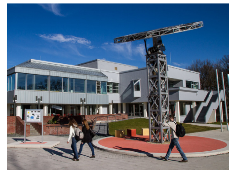
Westsächsische Hochschule – Campus Scheffelstraße 39