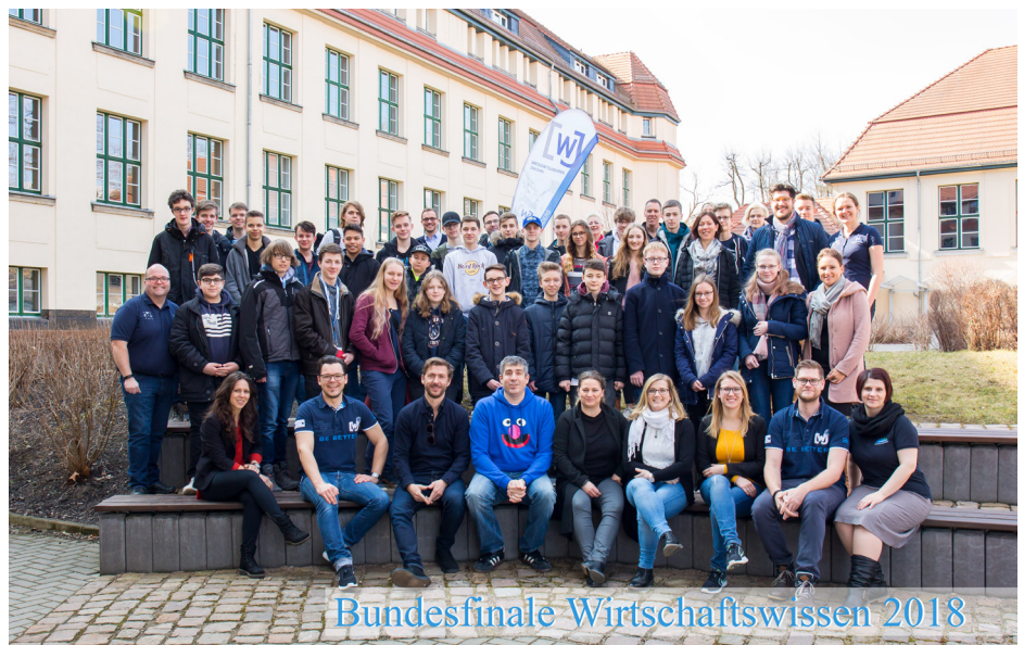
Bundesfinale Wirtschaftswissen 2018