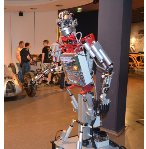
Lange Nacht der Technik