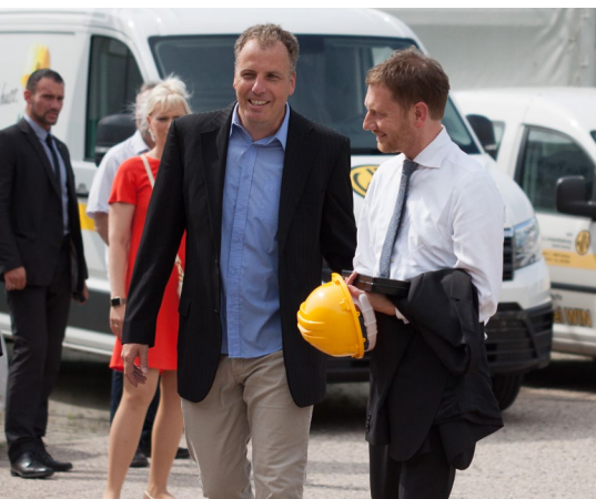
Der Ministerpräsident gratuliert zum Firmenjubiläum