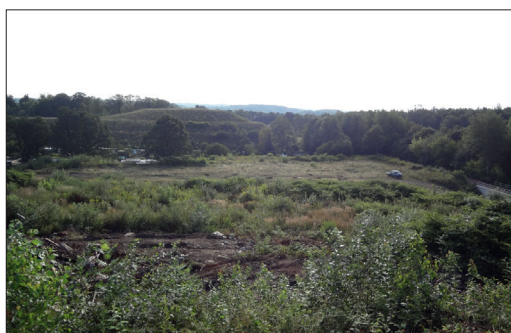
Vor Beginn der Baumaßnahme

Die Deponiesanierung und der Bau des Rückhaltebeckens sind wichtige Bausteine der sogenannten inneren Erschließung des Industrie- und Gewerbegebietes an der Reichenbacher Straße. Bereits 2010 wurde die Dr.-Sinsteden-Straße als Erschließungsstraße gebaut, die zum neu errichteten F & E-Zentrum der Firma Hoppecke und zum Firmengelände von Johnson Controls führt. Geplant ist, dass ab 2015/16 die sogenannte Südstraße gebaut wird, welche die Flur- und die Hilfgotteschachtstraße miteinander verbindet. Unmittelbar daran anschließen sollen sich der grundhafte Ausbau der Hilfgotteschachtstraße und der Flurstraße inkl. der jeweiligen Einmündungsbereiche zur Reichenbacher Straße. Parallel ist die Revitalisierung der Flächen der ehem. Oberflächentechnik Zwickau (OTZ) geplant mit dem Ziel der Schaffung gewerblich nachnutzbarer Fläche.