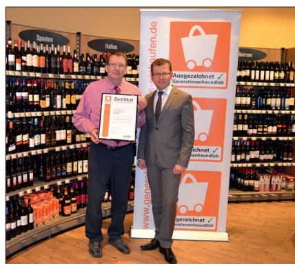
EDEKA Markt Feller

Mit dem Qualitätszeichen „Generationenfreundliches Einkaufen“ werden seit 2010 Einzelhandelsunternehmen ausgezeichnet, die sich aktiv mit dem demographischen Wandel auseinandersetzen. Das sind Geschäfte, in denen der Einkauf für Menschen aller Altersgruppen, Familien und Menschen mit vorübergehenden oder ständigen gesundheitlichen Handicaps so komfortabel, angenehm und barrierearm wie möglich ist.