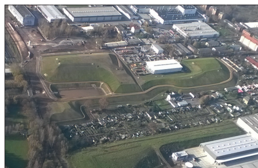
Nach beendeter Baumaßnahme

Mit den abgeschlossenen und geplanten Maßnahmen betreibt die Stadt Zwickau gemeinsam mit ihren Partnern und dank der Förderung eine nachhaltige und zukunftsfähige Standortentwicklung. Damit erhalten ansässige Unternehmen gute Bedingungen – weitere Investitionen werden ermöglicht.