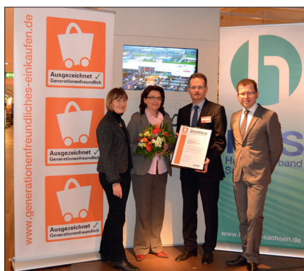
Porta Möbel Handels GmbH & Co. KG Zwickau