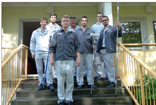
Johnson Controls Mitarbeiter packen im Wohnprojekt Neuplanitz mit an und renovieren den Gemeinschaftsraum.

Die Hilfe für Flüchtlinge ist Teil des unternehmensweiten sozialen Programms „Blue Sky Involve“ von Johnson Controls. Seit 2006 haben Mitarbeiter mehr als 370 Projekte in 43.000 Freiwilligenstunden in Deutschland durchgeführt. In Zwickau hat das Werk beispielsweise die „Zwickauer Tafel“ oder das „Hermann-Gocht-Haus“ unterstützt.