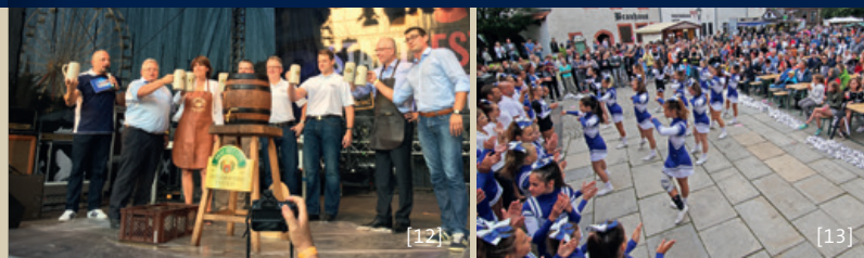
[12] Fassbieranstich [13] Zwickauer Cheerleader e. V.