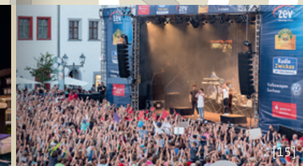
[14] Stadtfeststimmung Hauptmarkt [15] Impression Hauptmarkt