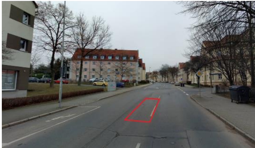
Fußgängerquerungshilfe über die Karl-Keil-Straße