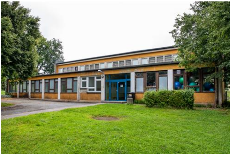
Turnhalle an der Windbergschule