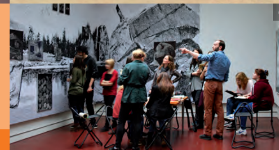
Titelbild: König-Albert-Museum, 1914